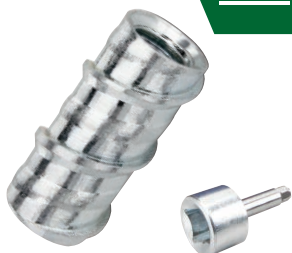
スネイク専用セッティングツール 差込角 12.7(全サイズ)